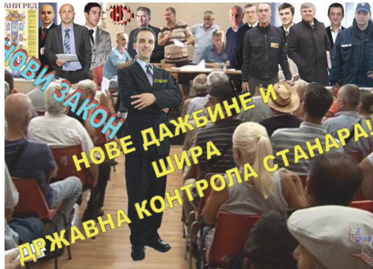
ИЛУСТРАЦИЈА СА ПОРТАЛА „ГЕТО СРБИЈА“